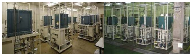
図4 大阪ガスにおけるスタック耐久評価設備

劣化もその様相は千変万化である。 (5) 」と表現されるほど、SOFCの耐久性を確立する上で考慮すべき点は多い。しかし、多くの要素試験、長期耐久試験（スタック、システムの実証試験）とその解析を経て、劣化の支配因子に関する知見が高まり、寿命を目標レベルまで設計できる段階になってきた。