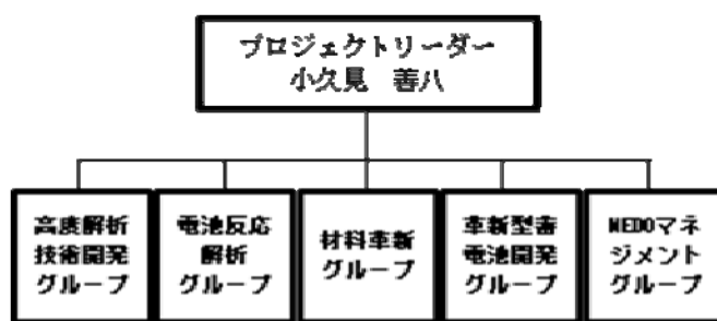
図 1 RISING プロジェクトの体制

図 1 に示すように RISING プロジェクトには 4 つの研究グループがあり、高度解析技術開発グループと電池反応解析グループは電池内現象の徹底解明、材料革新グループは先の二グループで得られた知見をベースとしたリチウムイオン電池材料開発ガイドラインの提示、革新電池グループはそれらの知見を集大成したポストリチウムイオン電池開発をミッションとしている。蓄電池は、ニッケル水素・リチウムイオンを先行商用化した日本のお家芸であるだけでなく、自動車という日本の基幹産業を電気自動車の性能を通じて左右し、また電力需給を管理するスマートコミュニティの核ともなる、重要な位置づけにある。電池のイノベーションを通じて、次世代蓄電池開発の中核を構築する役割を担うことも、RISING プロジェクトの使命である。