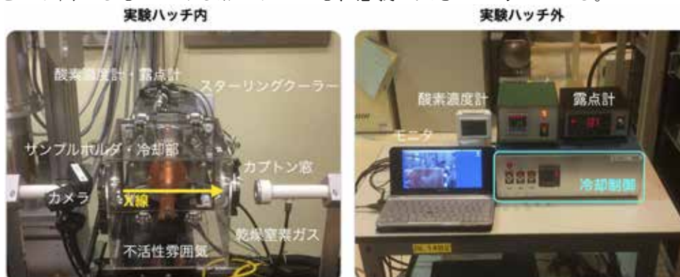
図 2. 溶液サンプル冷却装置

また今回、反応溶液の operando XAFS 測定に使用する温度制御が可能な、溶液サンプル冷却装置の開発に着手した (図 2)。スターリングクーラーによる冷却により、溶液サンプルの XAFS 測定が -100^\circ\text{C} の条件で可能になった。今後、この装置の改良に努めるとともに、低温反応や精密温度制御が必要とされる反応の溶液 operando XAFS 測定に用いたい。なお、溶液状態のサンプルを冷却して溶液 operando 測定した前例はこれまでにない。したがって、冷却装置の開発は溶液 XAFS の有効性をより高めるものである点においても、意義が大きいと考えている。